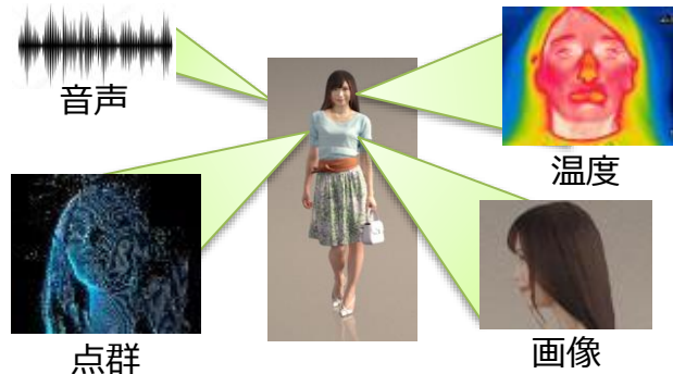
様々なセンシング情報 (マルチモーダル信号)

多数のセンサーにより収集されている画像や映像に代表される観測データは、日々その量が増大しています。特に近年はセンサーが増加かつ多様化しており、貯めきれないデータは捨てざるを得ません。そこで、モーダル間の関係性や拘束条件に着目し、観測データを捨てることなく活用できるようコンパクト化し整理保管するための基盤技術を開発し、結果としてデータの価値を高め、伝送・蓄積コストを低下させることを目標としています。